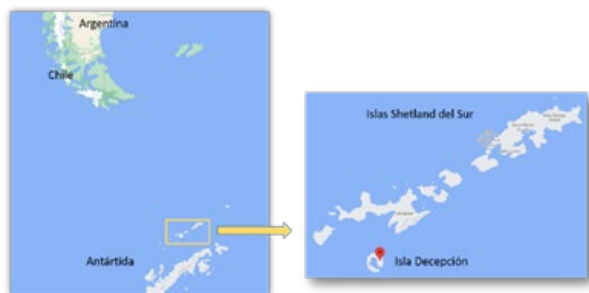
Fig. 1. Localización de Isla Decepción en el archipiélago de las Shetland del Sur.

Los diferentes compuestos de dichos filtros de material particulado se caracterizaron químicamente por diferentes técnicas, como son ICP-MS, Raman y SEM-EDS. Además, el análisis de las retro trayectorias de las masas de aire de los días previos al muestreo ayudó a conocer las fuentes potenciales de dicho material particulado.